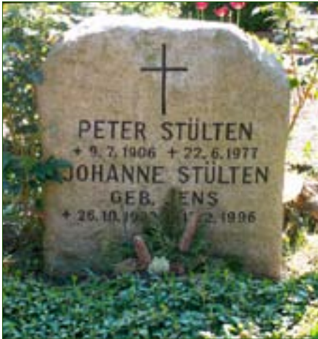
Min fars grav i Horneburg