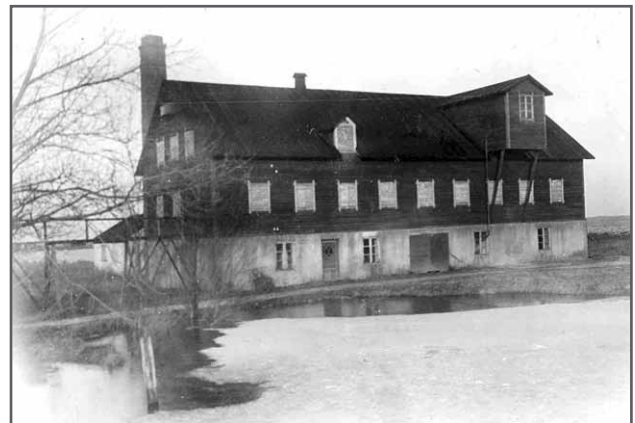
Ett lagerhus vid Burgsviks hamn som senare blev restaurang Guldkaggen. Ungefär här intill hamnen kan Jurgen Smiterlow kring 1600 ha haft sitt hus med bostad och kontor. (Fotot tycks vara från sekelskiftet 1900 och tillhör Öja kyrkbys kulturförening)

Samboendet med pigan fortsatte några år,