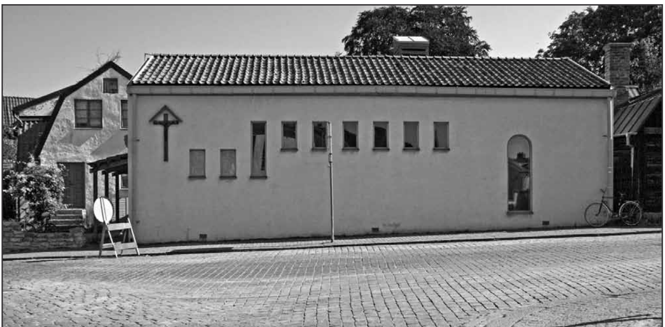
Kristi Lekamens kyrka i Visby.

Dagens katolska församling startade alltså 1933 med en kapellförsamling på Tranhusgatan, då det var ett 10-tal medlemmar i församlingen. 1937 flyttade församlingen till Kilgränd där den höll till tills den nuvarande kyrkan byggdes 1982. Lokalen på Kilgränd har sedan varit lokal för den ortodoxa kyrkan, sedan modist-