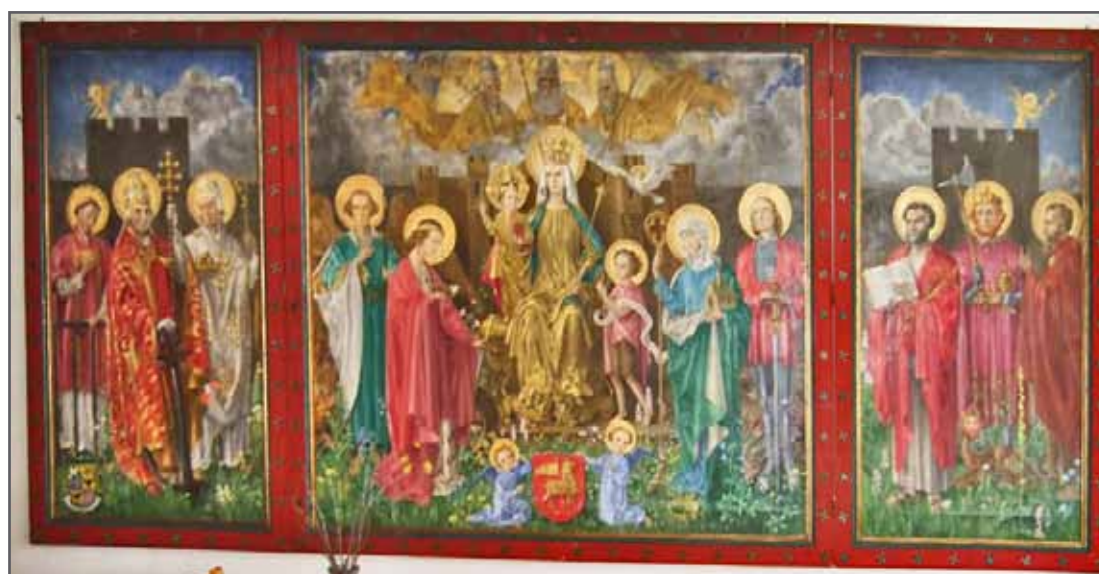
Altartavlan från Kapellet i Kilgränd.

kare be kyrkoherden i församlingen om utskrift av böckerna om man anger vad och till vilket ändamål man skall använda utskriften.