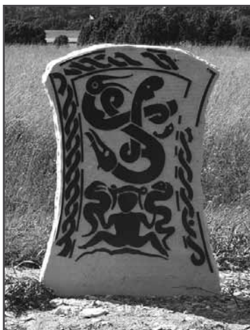
Kopia av bildsten.

Föreningen har tagit fram en ny CD. Den här gången är det Lemkes Visby stifts herdaminne. Men information på sidan 3.